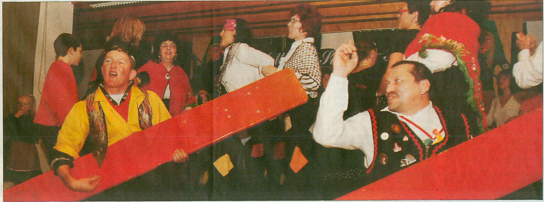
Beliebtes Instrument bei den Grünmettstetter Narren: Die Bierbank-Gitarre.