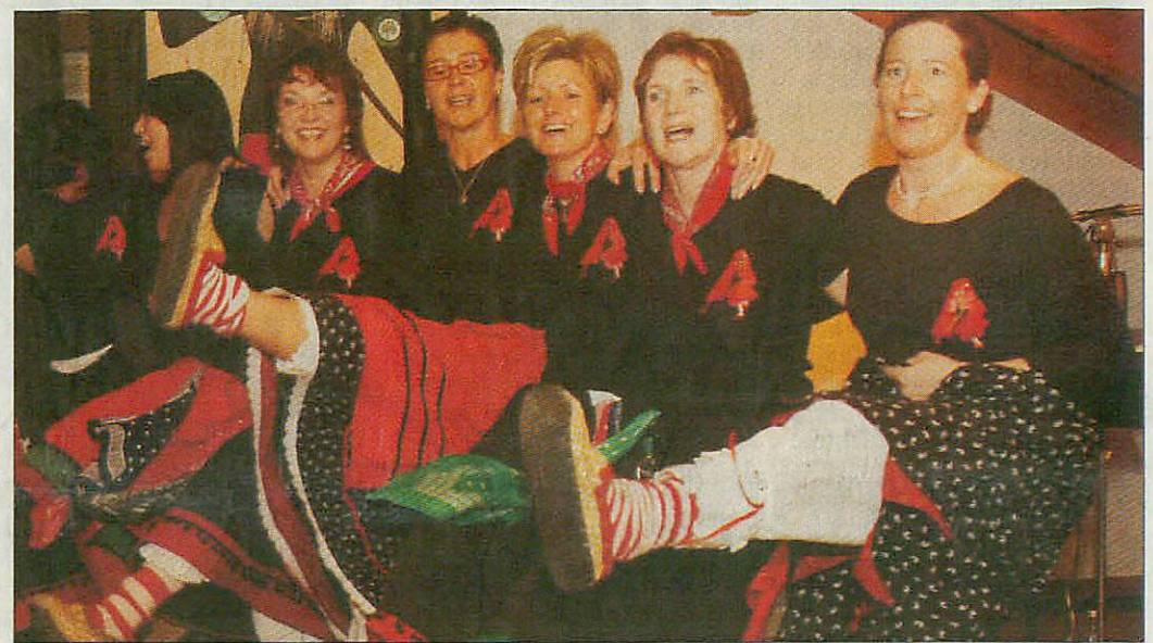
Nette Hexen, die da so ausgelassen tanzen.